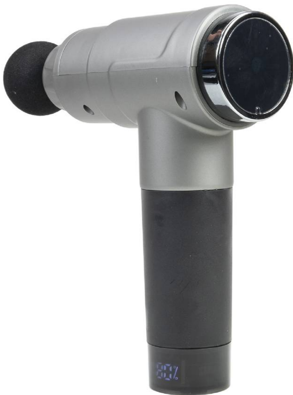
Vedere 3/4 - afișaj digital activ