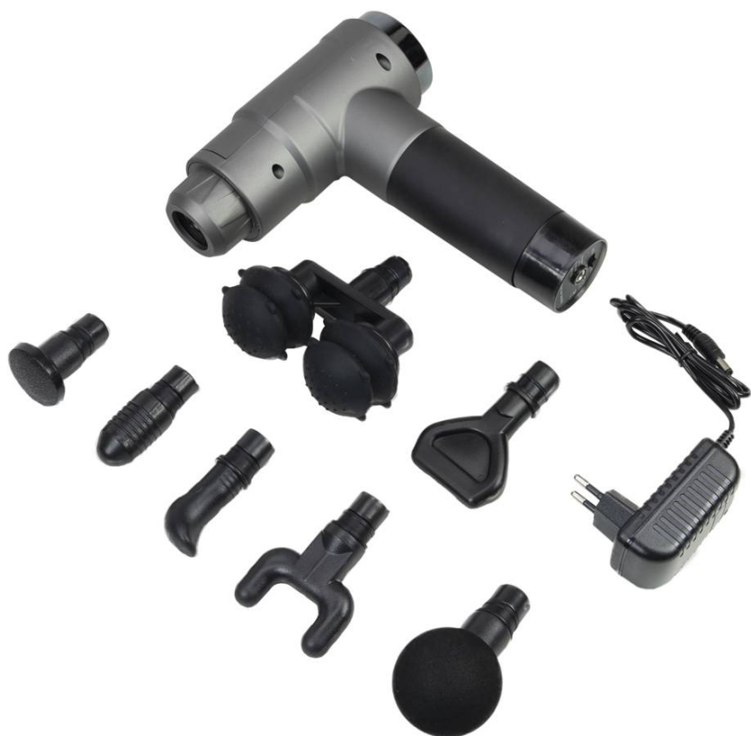
Pachet complet - aparat, 7 capete, încărcător