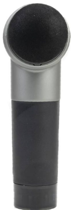
Vedere frontală - cap montat