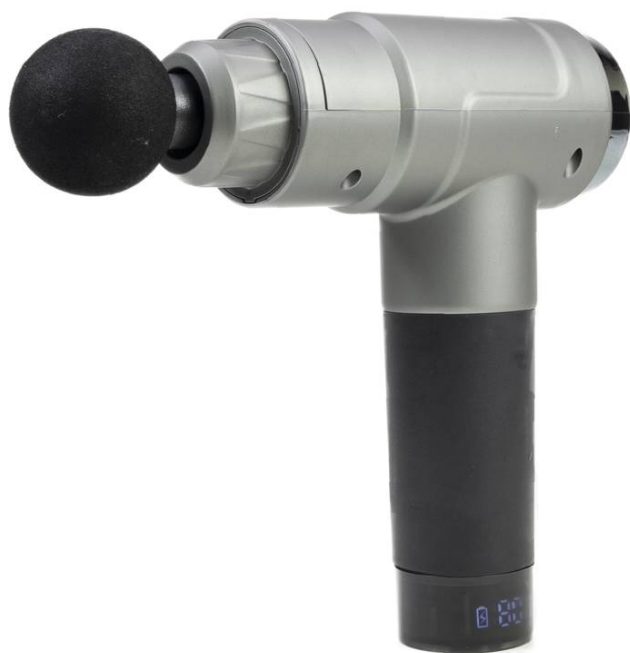
Vedere laterală stânga - afișaj digital activ