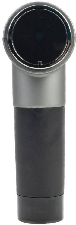
Vedere din spate - panou de control și prindere