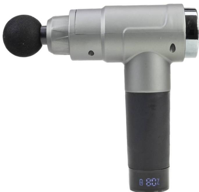
Vedere laterală dreapta - afișaj digital activ